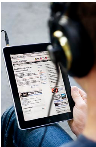
Un tercio de la población sueca lee las noticias en Internet.

En el 2010 se imprimieron en Suecia alrededor de 3,5 millones de periódicos al día, excluyendo la prensa gratuita. En días de semana, un 81 por ciento de la población sueca lee un periódico matutino. De los 168 diarios de ese tipo que se venden en Suecia, la mayoría se pueden leer también en Internet. Un 30 por ciento de los suecos dice que visita con regularidad un sitio web de noticias.