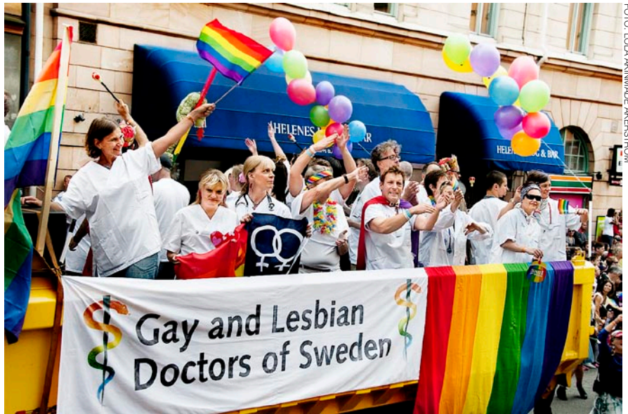
Se protegen los derechos de las minorías. Las leyes y normas suecas no pueden conducir a que nadie se vea desfavorecido debido a su pertenencia a una minoría.

Por medio de los servicios públicos de televisión (SVT) y radiodifusión (SR), todos los ciudadanos tienen acceso a una gama variada de programas sin publicidad. Las operaciones se llevan a cabo de forma independiente del Estado sueco y de otros intereses económicos y políticos. Además, hay varios canales comerciales.